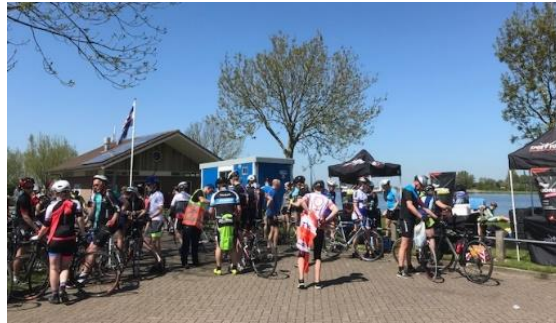
Controle- en verzorgingspost Oudega