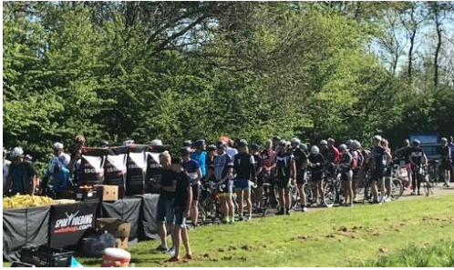
Controle- en verzorgingspost Elahuizen